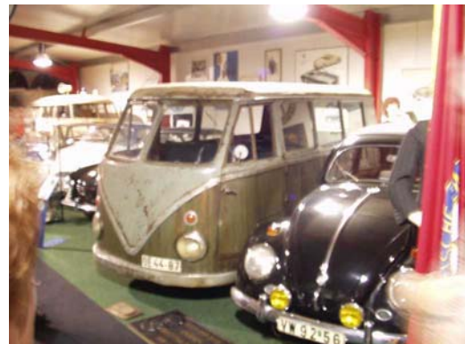
Sambabus aus Holz gefertigt (DDR)

Nach dem ersten Höhepunkt fuhren wir im Corso zu unseren gemeinsamen Unterkunft. Von dort aus ging es, nachdem Gepäck in den Zimmern verstaut war mit einem kurzfristig gecharterten Taxibus in zwei Etappen zu einem gemeinsamen Abendessen. Nach dem Essen die gleiche Prozedur zurück zum Hotel. Hier konnte man den Abend auf der Terrasse mit einem Bier bzw. Wein oder Wasser noch ein wenig ausklingen lassen. Frisch und Ausgeruht, jeder konnte inzwischen schon die Geschichte der Wirtin des Hauses Christophers und insbesondere die deren Mercedes, ging es auf die eigentliche Tour. Start zur großen Ausfahrt quer durch das Schaumburger Land und rund um das Steinhuder Meer. Dank des hervorragend ausgearbeiteten Roadbook mit Chinesenzeichen gelangten alle zum ersten Haltepunkt nach Hude. Dort konnte man das Schmetterlingsmuseum besuchen, an der Promenade des Steinhuder Meeres flanieren oder einfach nur ein Fischbrötchen essen. Leider hatten wir an diesen Tag nicht so viel Glück mit dem