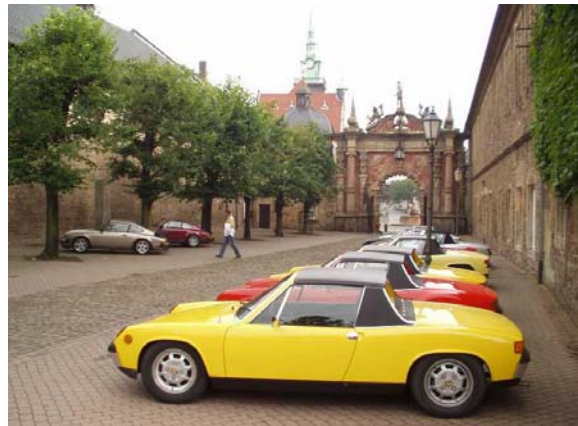
Gruppenbild mit Elfern