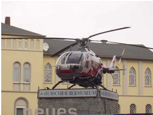
Vor dem Hubschraubermuseum